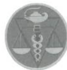
Peruvian Endocrine Society